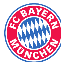
FC Bayern München