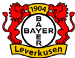
Bayer 04 Leverkusen